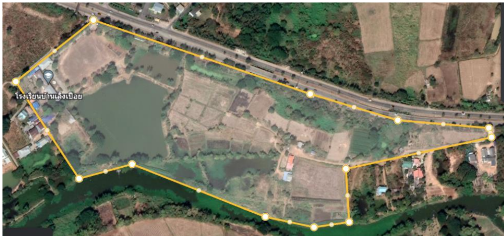
พื้นที่โรงเรียนบ้านเลิงเปือย ภาพ จาก Google Maps

พื้นที่ทั้งหมด : ๕๗ ไร่ ๓ งาน ๓๑.๕ ตารางวา